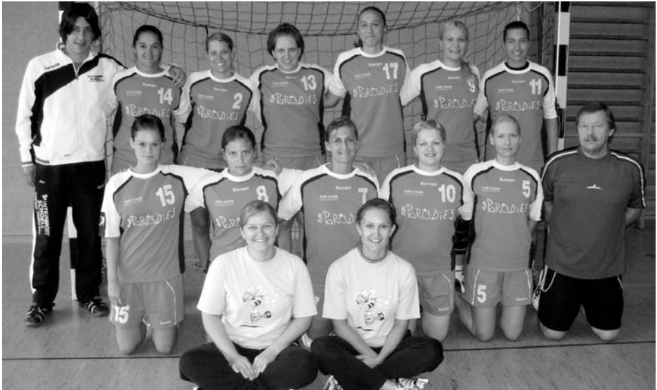
Hinten von links nach rechts:

Natürlich kamen gesellschaftliche Aktivitäten während der Saison nicht zu kurz. Der Ausflug nach Nordheim mit Weinprobe im Weingut Rolf Willy, gemeinsame Paradies-Abende, ein Grillfest, diverse Turnierbesuche und ein „Rehntierauf-