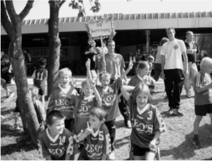
Die Minis beim Spielefest am 6. Juli in Steinheim