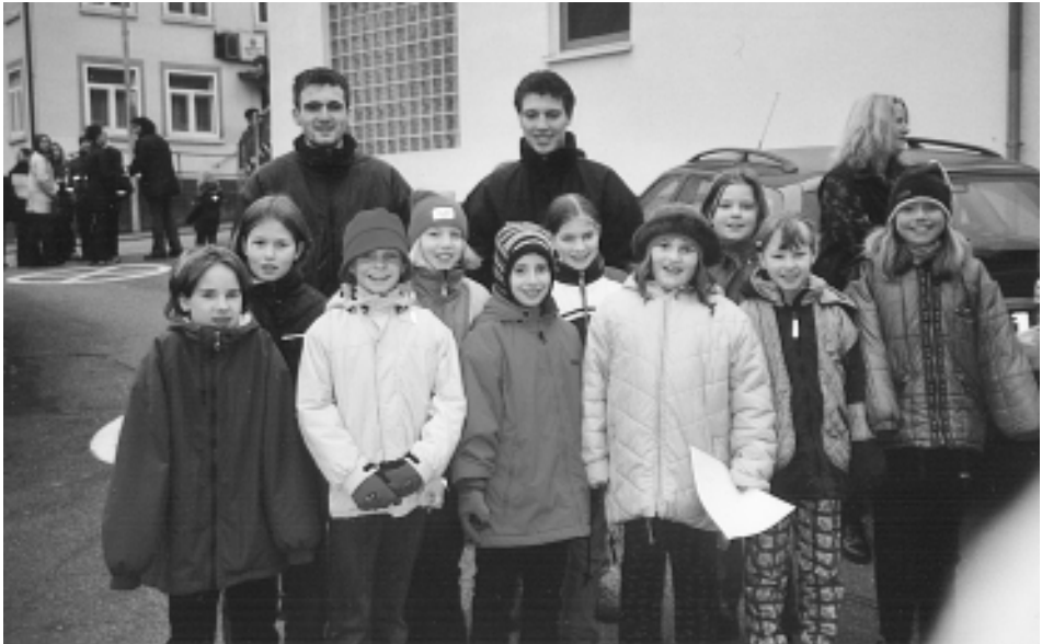
Das Bild zeigt die E-Jugend-Mädels bei der Dorfralley anlässlich der Jugendweihnachtsfeier.

Beim Turnier in Bartenbach konnte ein 4. Platz erreicht werden, ein Erfolg für die neuformierte Mannschaft.