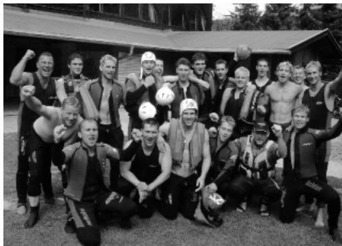
Rafting - Ausflug der 1. Männer- mannschaft nach Haiming.